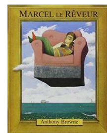
Marcel le rêveur Ecole des Loisirs